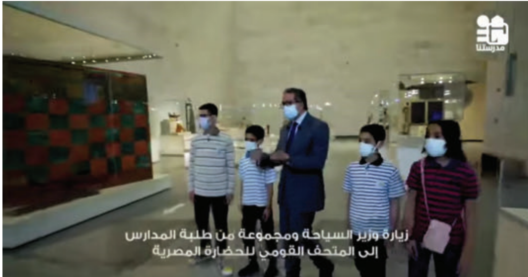
زيارة وزير السياحة ومجموعة من طلبة المدارس إلى المتحف القومي للحضارة المصرية

فى مبادرة هى الأولى من نوعها، اصطحب وزير السياحة والآثار أ. د. خالد العناني مجموعة من طلبة المدارس فى جولة إرشادية داخل المتحف القومي للحضارة بالفسطاط لتعريفهم بهذا الإنجاز الحضارى العظيم وتاريخ أجدادهم و قد تم تصوير الجولة و بثها على قناة مدرستنا التعليمية حيث يشاهدها طلاب المدارس وأسرهم بعدد يصل إلى 20 مليون مشاهد، هذا وتعتبر هذه المبادرة خطوة نحو نشر الوعي السياحي والأثري وتنمية الانتماء لدى النشء، جاء ذلك فى إطار بروتوكول تعاون الموقع بين وزارتي السياحة والآثار، والتربية والتعليم، والتعليم الفني بشأن نشر أخلاقيات السياحة ورفع الوعي السياحي والأثري لدى طلبة المدارس.